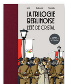
LA TRILOGIE BERLINOISE T.1 : L'ÉTÉ DE CRISTAL Pierre Boissier, François Warzala