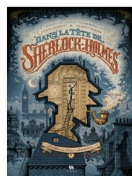
DANS LA TÊTE DE SHERLOCK HOLMES T.1 Cyril Lieron, Benoit Dahan