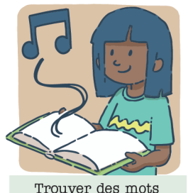
Trouver des mots qui riment pour créer une chanson