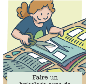
Faire un bricolage avec de vieux magazines