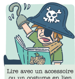
Lire avec un accessoire ou un costume en lien avec l'histoire