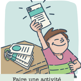
Faire une activité proposée dans les fiches Lit de camp