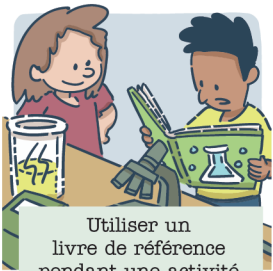
Utiliser un livre de référence pendant une activité scientifique