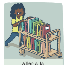
Aller à la bibliothèque