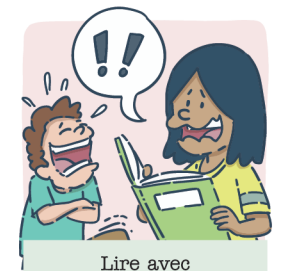
Lire avec une drôle de voix