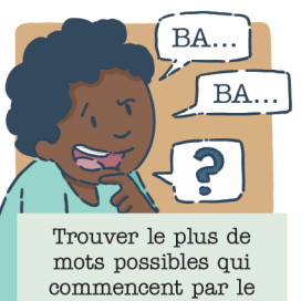
Trouver le plus de mots possibles qui commencent par le même son