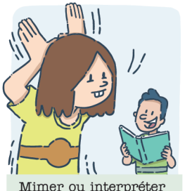
Mimer ou interpréter les personnages durant la lecture d'une histoire