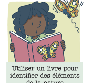
Utiliser un livre pour identifier des éléments de la nature (par ex. : les arbres, les insectes, les roches, etc.)