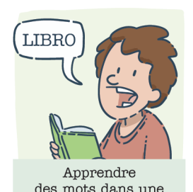
Apprendre des mots dans une autre langue