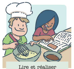
Lire et réaliser une recette