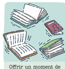
Offrir un moment de lecture libre