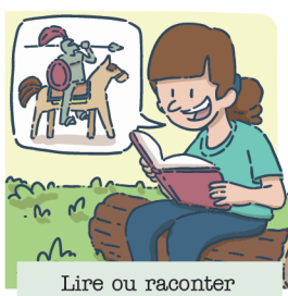
Lire ou raconter une légende