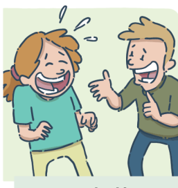
Raconter des blagues