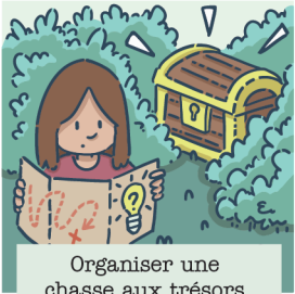
Organiser une chasse aux trésors à l'aide d'indices