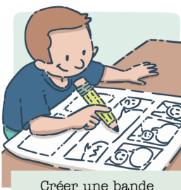
Créer une bande dessinée