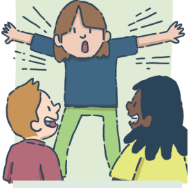
Faire des charades