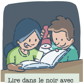
Lire dans le noir avec des lampes de poche