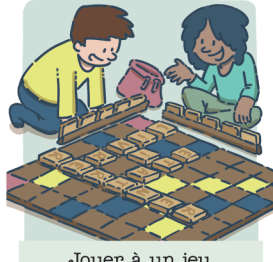
Jouer à un jeu de société