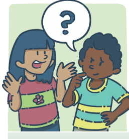
Faire des devinettes