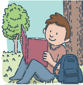
Lire au parc